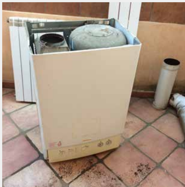
F - Foto del locale una volta dismesso il vecchio generatore